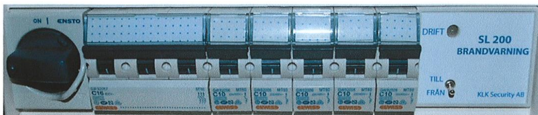
SL-200 asennettuna ryhmäkeskukseen