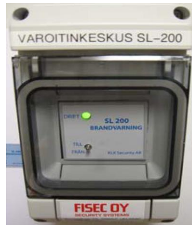
Keskuskoje SL-200 pintakotelossa